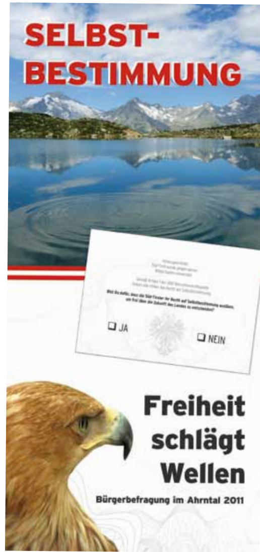
Das Plakat der Südtiroler Freiheit hat bereits hohe Wellen geschlagen