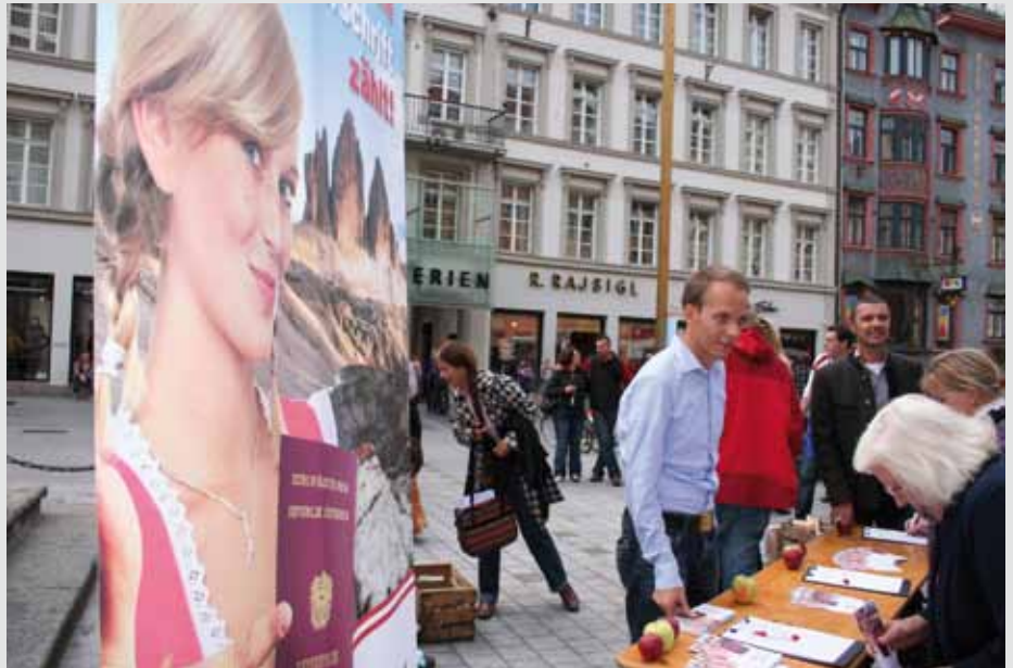
Der Unterschriftenstand der „Südtiroler Freiheit“ in Innsbruck

Wer die parlamentarische Bürgerinitiative für das Wiedererlangen der österreichischen Staatsbürgerschaft zusätzlich zur italienischen mit seiner Unterschrift unterstützen möchte, hat noch bis zum 31. Jänner 2011 die Möglichkeit dazu. Die entsprechende Unterschriftenliste liegt dieser Ausgabe der „Pustertaler Zeitung“ bei oder kann auch über die Internetseite www.suedtiroler.at heruntergeladen werden. Die Listen müssen bis zum 31. Jänner an die SÜD-TIROLER FREIHEIT, St. Josef am See 74, 39052 Kaltern, geschickt werden. Alle Südtiroler Bürgerinnen und Bürger können daran teilnehmen.