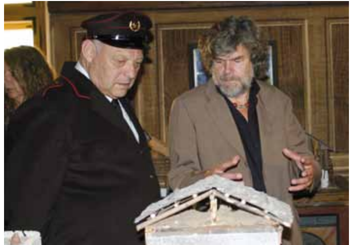
Hoch oben ist der Blick nach unten besser