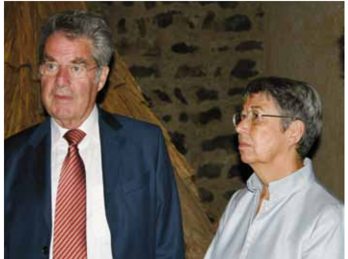
Das Präsidentenpaar war von der Ausstellung beeindruckt