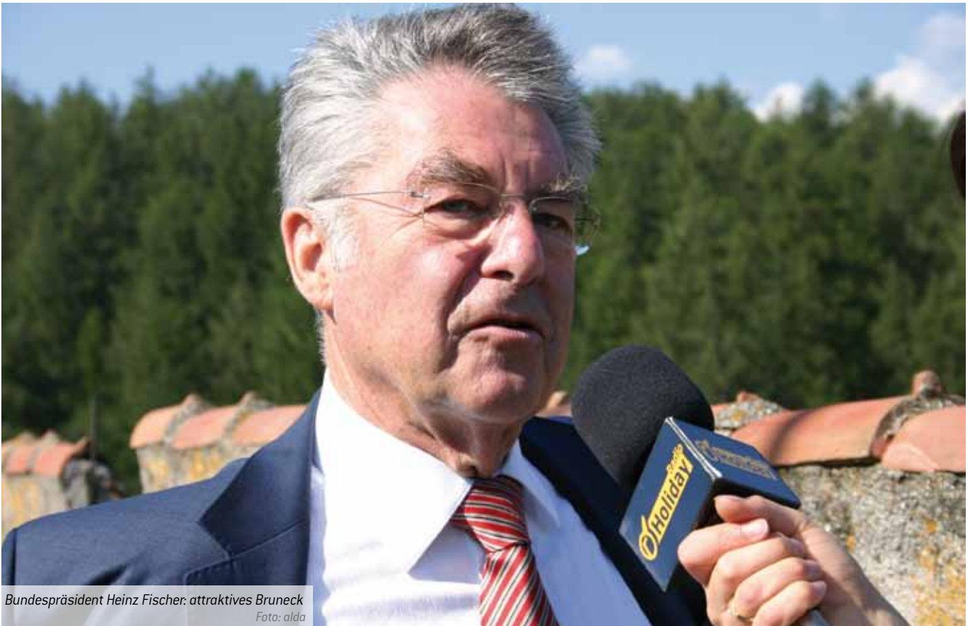
Bundespräsident Heinz Fischer: attraktives Bruneck