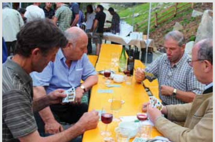
Nach dem Almseggen das obligate Watterle