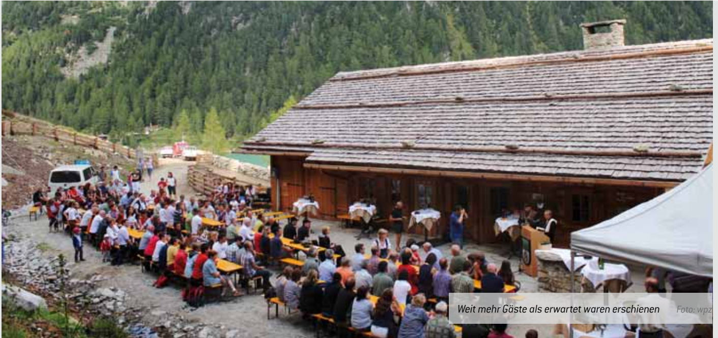
Weit mehr Gäste als erwartet waren erschienen