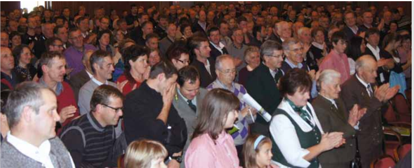
Die Bauern - im Bild anlässlich der Vollversammlung im Pacherhaus im Dezember 2011 - fürchten die neue Immobiliensteuer IMU.