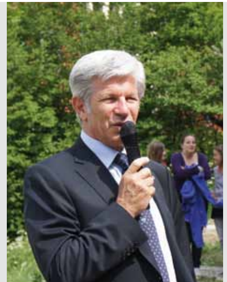
Vize-Gouverneur Hans Berger

Anlässlich der Jahreshauptversammlung der Pustertaler Bauern im Dezember des Vorjahres stand ein Thema im Mittelpunkt: Die Immobiliensteuer IMU. Damit soll zusätzliches Geld in die leeren Kassen des Staates gespült werden. Das Problem dabei: Ausnahmeregelungen gibt es keine, auch für die Bauern nicht. Sie haben zum Teil große Gebäude und mehrere Wohnungen, die entweder für den „Urlaub auf dem Bauernhof“ zweckgebunden sind oder von Hofkindern genutzt werden. SSB-Bezirksobmann Viktor Peintner hat schon seinerzeit Alarm geschlagen, hat auf die gravierenden Auswirkungen der IMU hingewiesen. Eine Sorge, die Vizeregierung Hans Berger durchaus teilt. Er war am 4. Jänner in Rom, um gegenzusteuern. Doch das Manöver war wenig erfolgreich, wie er im Gespräch mit Reinhard Weger aufzeigt.