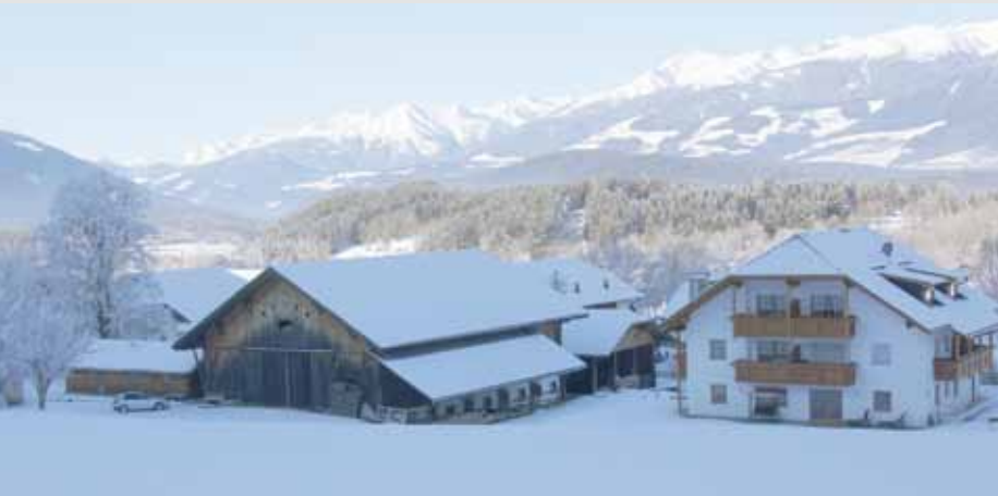
Die Bauernhöfe bestehen in der Regel aus großen Bauernhäusern, die auch mehrere Wohnungen inkludieren.